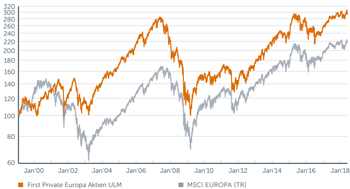
Wertentwicklung des First Private Europa Aktien ULM seit Auflegung im Vergleich zum MSCI Europe (Total Return Index). Berechnung der Wertentwicklung nach BVI-Methode, d.h. ohne Berücksichtigung des Ausgabeaufschlages. Wertentwicklungen in der Vergangenheit sind kein verlässlicher Indikator für die zukünftige Wertentwicklung.